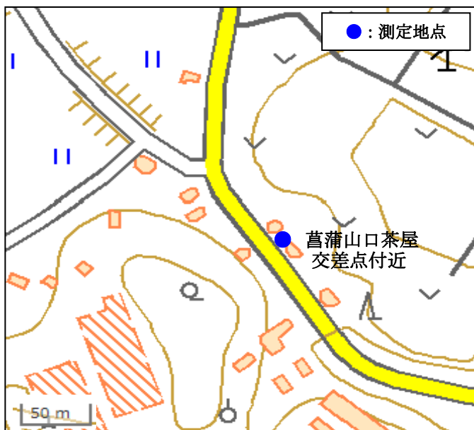
国土地理院の地理院地図